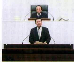
本会議場で退任あいさつ

「本格的な地方分権時代の中で『郷土茨城』が日本をリードしていく先進県としての地位を確立するため、今後とも努力を重ねてまいります」と新たな決意を力強く語りました。同時に、温かく支えてくれた地元の支援に心からの感謝をしています。