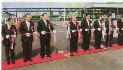
神栖国家石油ガス備蓄基地完成式典