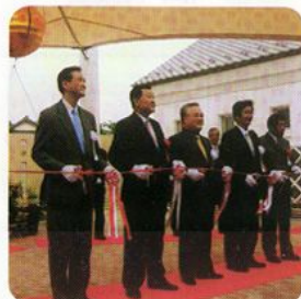
鹿島灘海浜公園開園式典