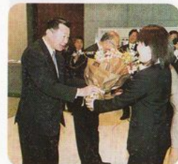
退任の日議会議務局より花束