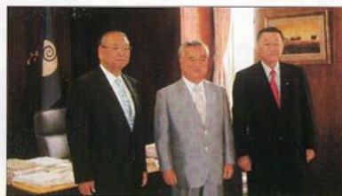
4選を果たした橋本知事 就任挨拶に来訪