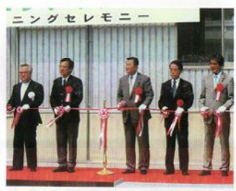
エコフロンティアがさま開業式典