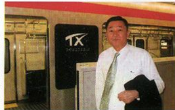
つくばエクスプレス試乗会

三位一体改革と地方分権時代で厳しさを増す財政状況に対して西条副議長は、「政策の厳しい選択と集中を徹底し、県民ニーズに的確に対応する効率的な行政運営が必要」と主張。「少子化や高齢化社会に備えた福祉・医療施策の抜本的・総合的な対策を講じるとともに、志の高い、心豊かな人間を育む教育が求められている」と教育・福祉へのぬくも