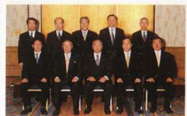
茨城、栃木、群馬、新潟、福島、5県議会議長会議