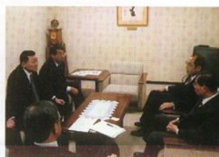
保立神栖市長と済生会本部へ波崎診療所開設の陳情