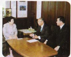
南野法務大臣へ意見書の提出