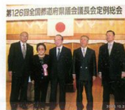
全国都道府県議会議長会（山口会長在職50年表彰）